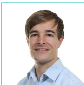
Dr. Van Parys M. schouder-, elleboog-, pols- en handchirurgie