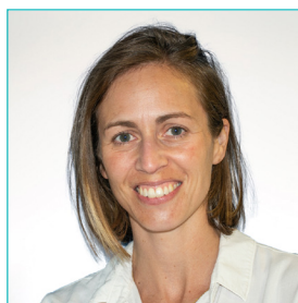
Dr. Lauwagie S. kinder- en neuro-orthopedie