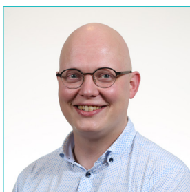
Dr. De Bo T. heup-, enkel- en voetchirurgie mavlaanderen.wordpress.com